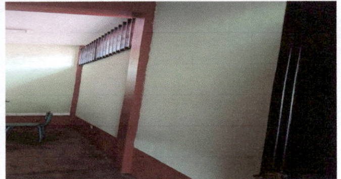
Foto 2: pintura de pared y columnas Interiores de todas las aulas