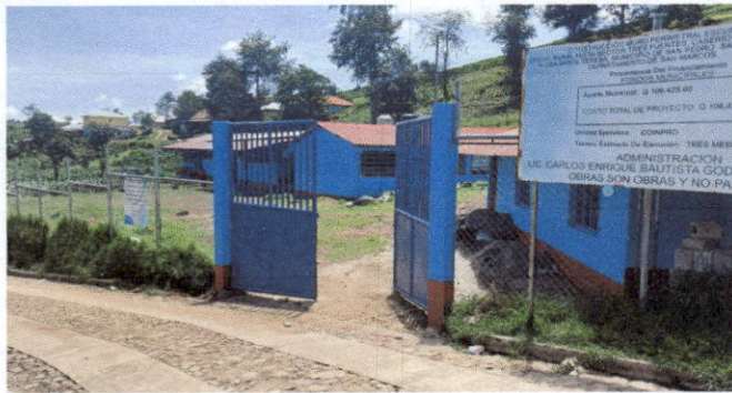
Foto 1: pintura de pared y columnas exteriores de todas las aulas